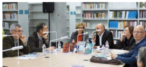
Table ronde autour d'Emile Durkheim. Mardi 5 décembre Bibliothèque Jourdan